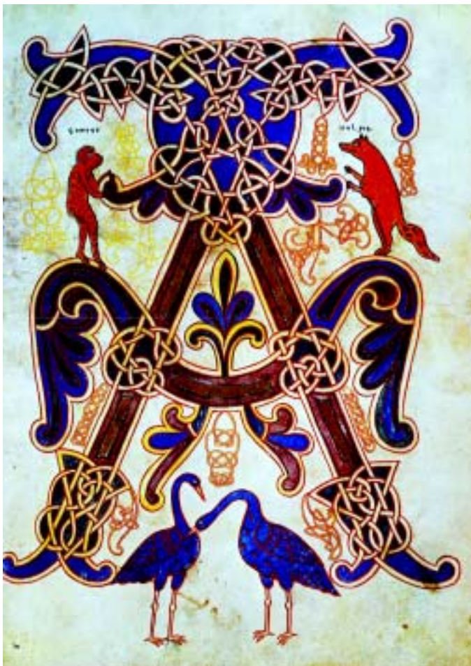
Beatus de Saint-Sever. Première Révélation de l'Apocalypse : Alpha, première lettre de l'alphabet grec, entouré d'arabesques et encadré par un singe et un renard.

Bibl. nat. France, ms. lat. 8878, fol. 14.