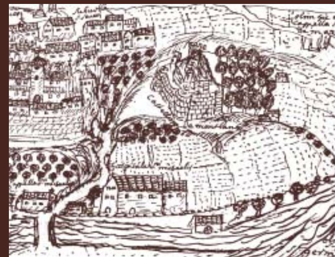
Le site de Saint-Sever au XVII e siècle d'après dom Du Buisson, historien de l'abbaye.

COLLOQUE. SAINT-SEVER, Salle des Jacobins 13-14 SEPTEMBRE 2008